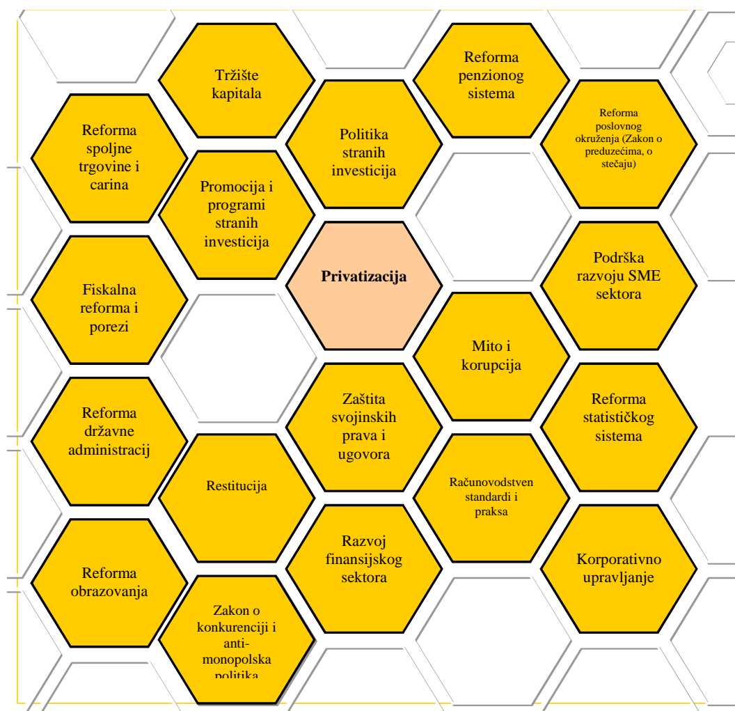
Grafik 1. Anatomija ekonomski reformi u Crnoj Gori

U ovom radu se ne žele prezentirati svaka oblast reforme pojedinačno. Iz prethodnog grafika manje-više u svim oblastima je učinjen određen progres. Mnogo više nego što se to možda u javnosti zna i osjeća 2 . Ali je potrebno još mnogo uraditi. Na tome i jeste naglasak ovog rada. U cilju razumijevanja konteksta ovih pitanja samo da ukažem na ključne principe ekonomskih reformi u Crnoj Gori: